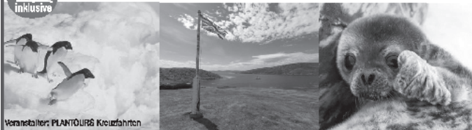
Voranstalter: PLANTOURIS Kreuzfahrten

MS HAMBURG – Ihr schwimmendes Zuhause auf See: