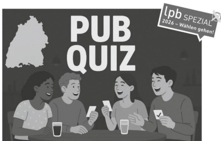
Foto generiert mit KI

Für alle, die mehr wollen als nur ein Kreuz auf dem Wahlzettel