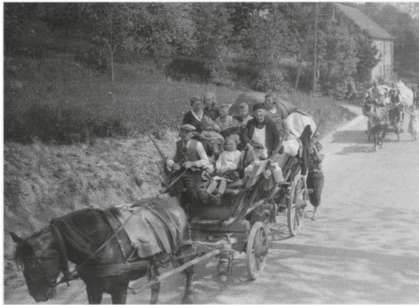
Foto: "L'Alsace annexée" von Jean-Laurent VONAU, Eckbolsheim 2022