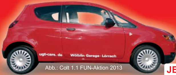
Abb.: Colt 1.1 FUN-Aktion 2013