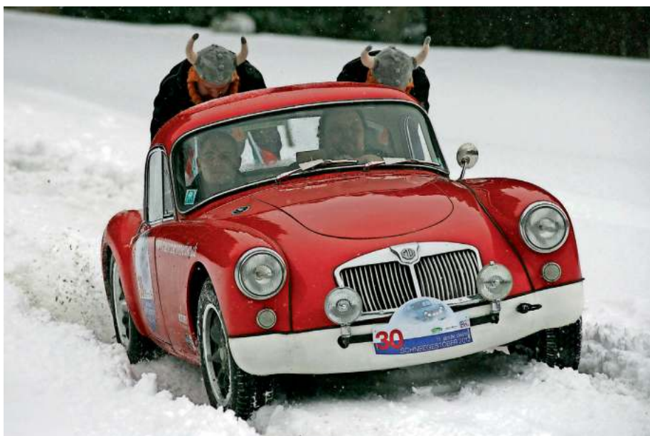
Zur Not mit Schiebehilfe auf schneebedeckten Straßen unterwegs: englischer Roadster vom MG