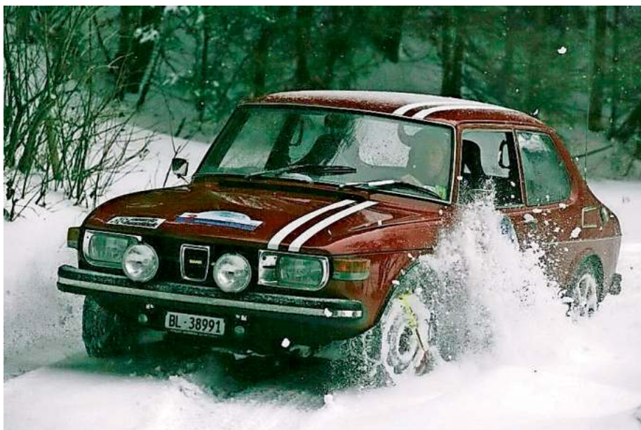
Beliebtes Rallye-Fahrzeug früherer Jahre: schwedischer Saab

Die Bevölkerung ist herzlich eingeladen, diese Ansammlung von seltenen historischen Fahrzeugen hautnah in der Fußgängerzone zu erleben.