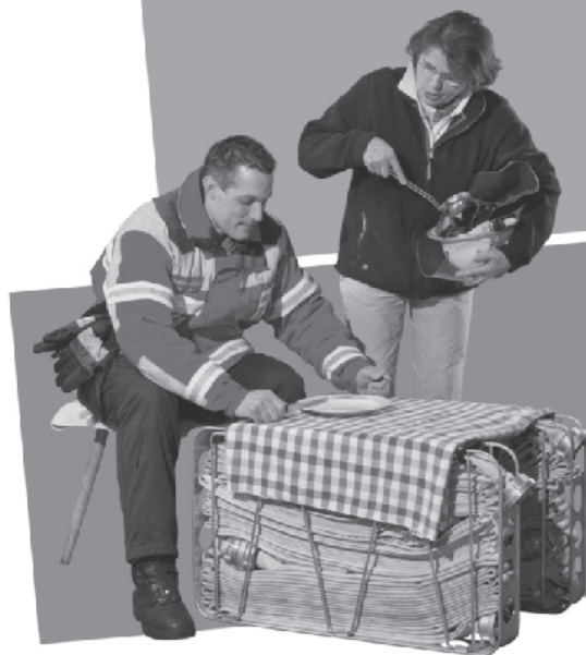
Fürs leibliche Wohl ist mit Getränken gesorgt.