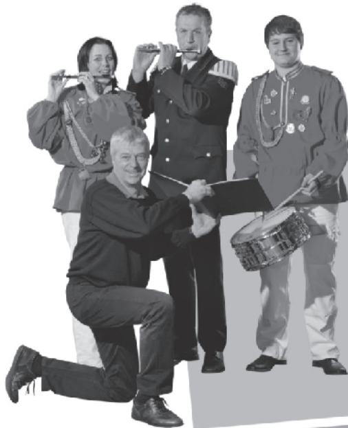
Musikalische Unterhaltung durch den Spielmannszug

Samstag, 27. September 2014 von 9.30 – 12 Uhr in der Fußgängerzone