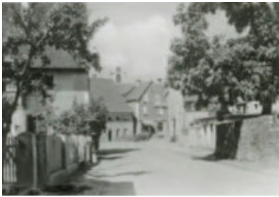
Hauptstraße um 1960