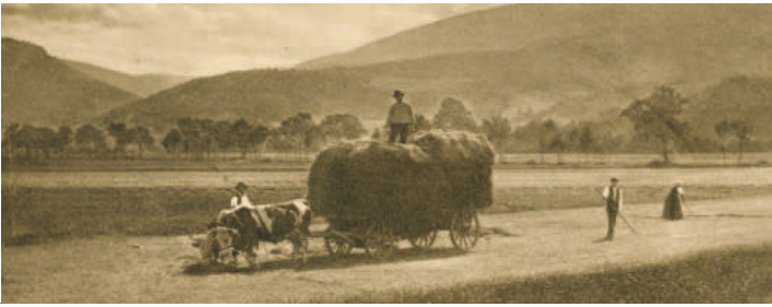
Heuernte am Grützweg