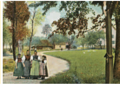
Geroldstal um 1920