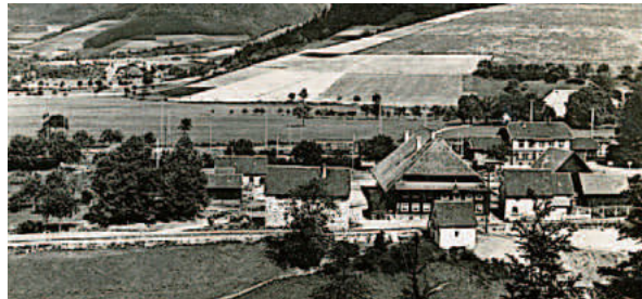
Himmelreich um 1936