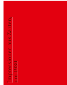
Impressionen aus Zarten, um 1930