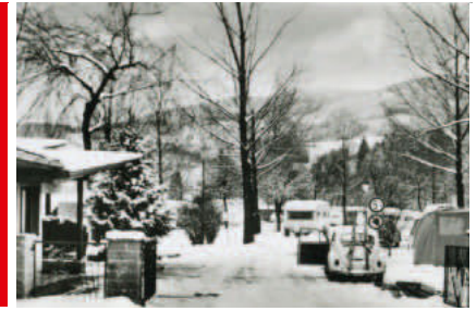
Impressionen von Postkarten aus der Sammlung Axel Steinhart