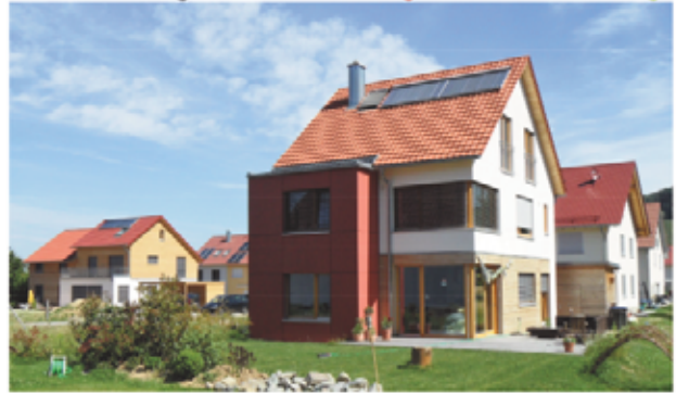
DHH in Heuweiler

1984-2018 Über 30 Jahre Holzbauerfahrung