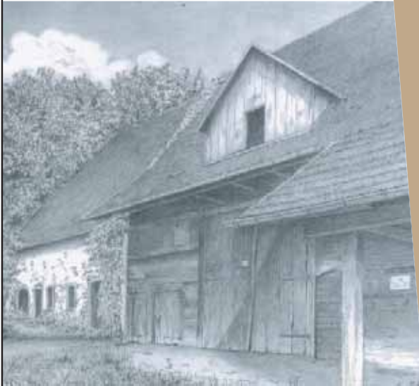
Zeichnung: CA Maasdam, 2014

Darüber hinaus werden an beiden Tagen Führungen durch das Rathaus Talvogtei angeboten: