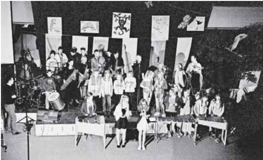
Lehrer und Schüler der Realschule am Giersberg gemeinsam auf der Bühne

Zum zweiten Mal präsentiert die Realschule am Giersberg am 6. April ab 18.30 Uhr einen Kulturabend – dieses Jahr unter dem Motto „Frühlingsfeuerwerk“. Die Klasse 8b sorgt für das Rahmenprogramm und ab 19.30 Uhr zündet dann ein musikalisches, theaterlisches, zirzensisches und tänzerisches Feuerwerk auf der Bühne im Foyer des Schulzentrum Dreisamtal. Alle Eltern, Freunde und interessierte Bürgerinnen und Bürger sind herzlich eingeladen!